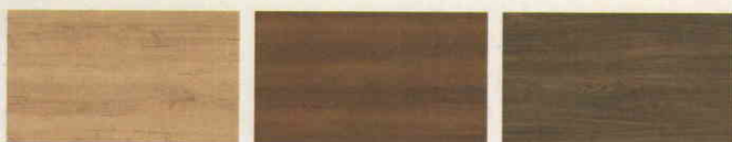
573 Dub MAHORN