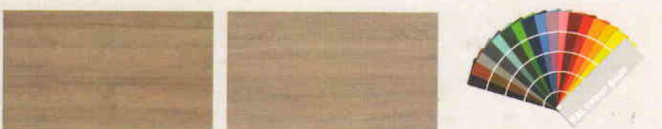
570 Dub LUCKY