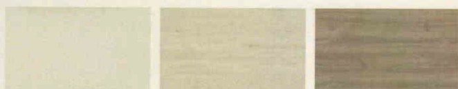
116 Biela UNIVERZAL