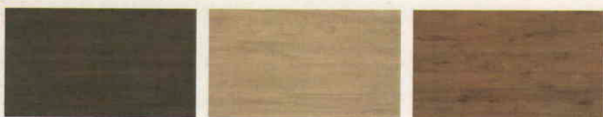
560 Orech PIERO