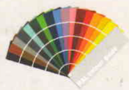
+ RAL farby